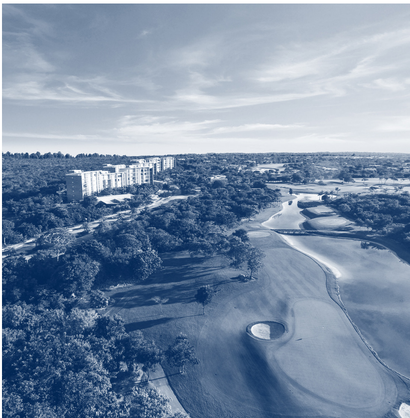
YUCATÁN COUNTRY CLUB / ANTHEA

“EL CÓDIGO DE CONDUCTA, en su caso, representa el comportarnos con integridad, responsabilidad, honorabilidad en estricto apego a nuestros principios que nos hemos trazado para llevar un negocio con disciplina y congruencia. Nos comprometemos y preocupamos para que los consejeros, accionistas, empleados y colaboradores se adhieran a un marco autorregulatorio que norme nuestra conducta y proceder.”